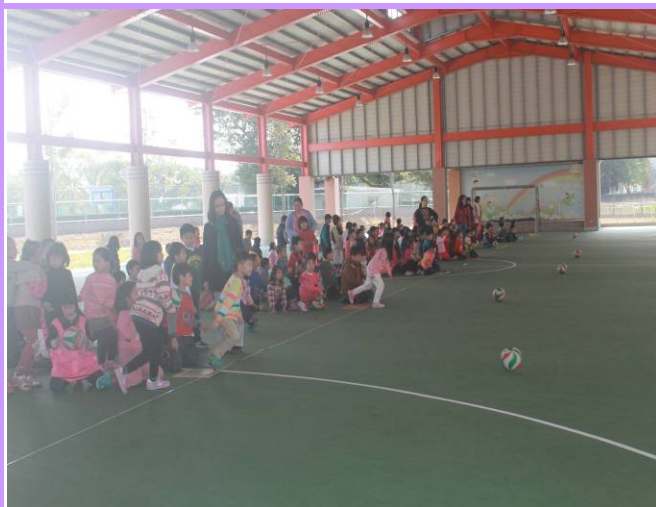
說明：一年級滾球賽