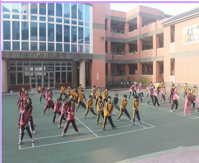
說明：四年級健康操觀摩賽