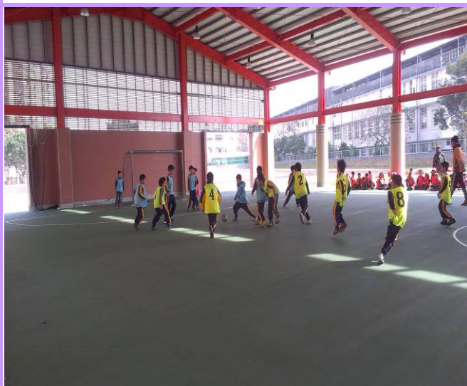
說明：三年級足球賽