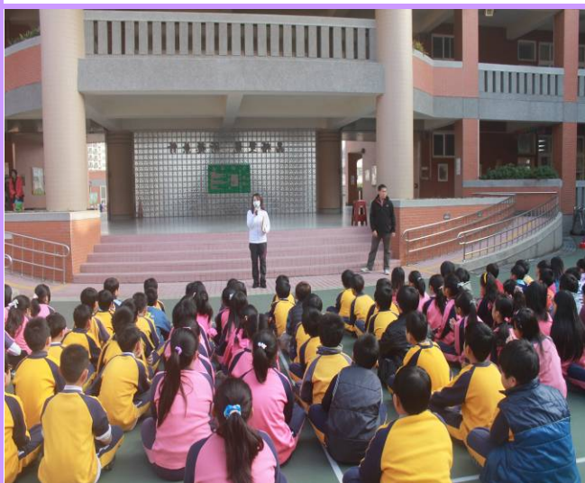
說明：四年級健康操觀摩賽-評審講評