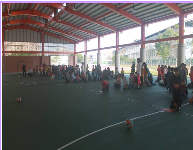
說明：二年級滾球賽